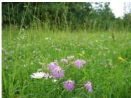
Vue d'une prairie au printemps

Vous pourrez vous procurer en début d'année, le programme 2011 des animations proposées par l'association auprès de votre commune.