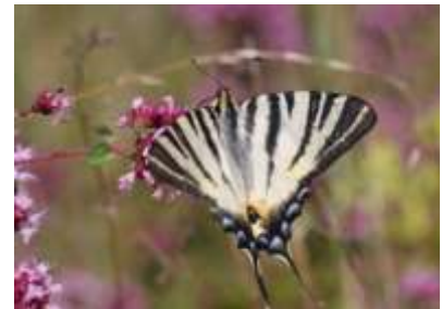
Le papillon Flambé hôte des pelouses sèches

C'est ce patrimoine naturel unique, que vous propose de découvrir l'association de gestion de la réserve naturelle de la Bassée tout au long de l'année, lors d'animations gratuites aux thèmes variés. Cette structure a aussi, comme missions communes aux 165 réserves naturelles nationales, la surveillance du territoire de la réserve (observation, suivis et études de la faune et de la flore, surveillance des activités) ainsi que la gestion de certains milieux naturels (fauche, débroussaillage de prairies par exemple).