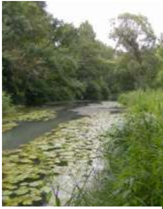
Cours d'eau et forêt humide

La réserve naturelle nationale de la Bassée , située dans la vallée de la Seine en amont de Bray sur Seine, a été créée par l'Etat en 2002 afin de préserver sur 854 ha un patrimoine naturel exceptionnel.